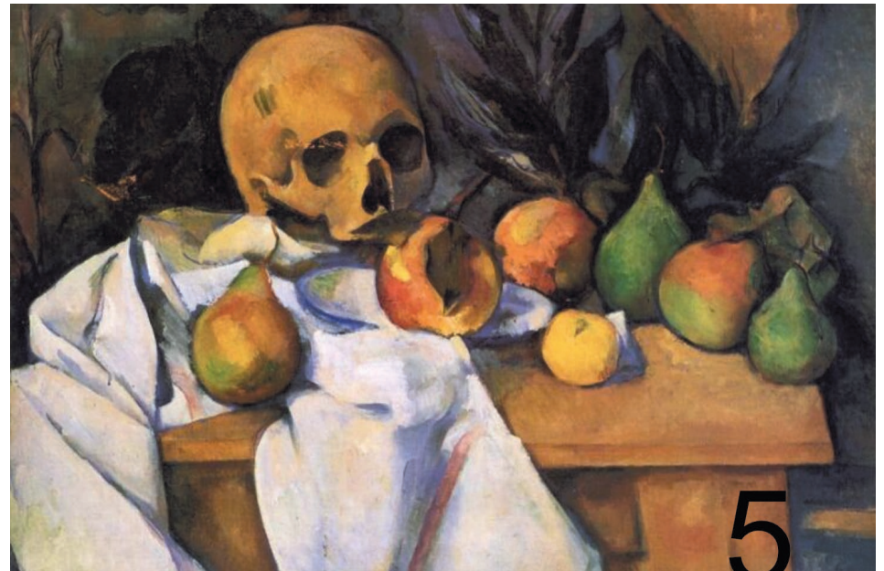
Paul Cézanne, Martwa natura z czaszką, ok. 1898 Fundacja Barnes, Filadelfia, https://www.collection.barnesfoundation.org/objects/4712/Still-Life-with-Skull-(Nature-morte-au-crane/)