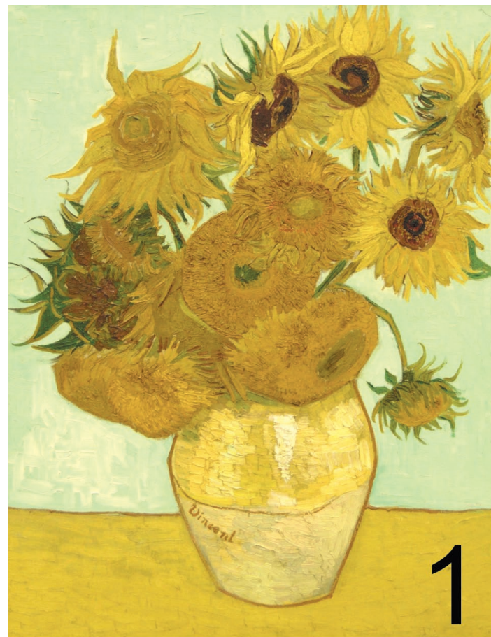
Vincent van Gogh, Stoneczniki (F456), 1888. Neue Pinakothek, Monachium, Niemcy, https://www.vggallery.com/painting/over_06.htm