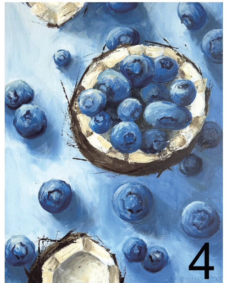
Marta Machowiak Kokosy i borówki, https://www.gallerystore.pl/marta-machowiak-3