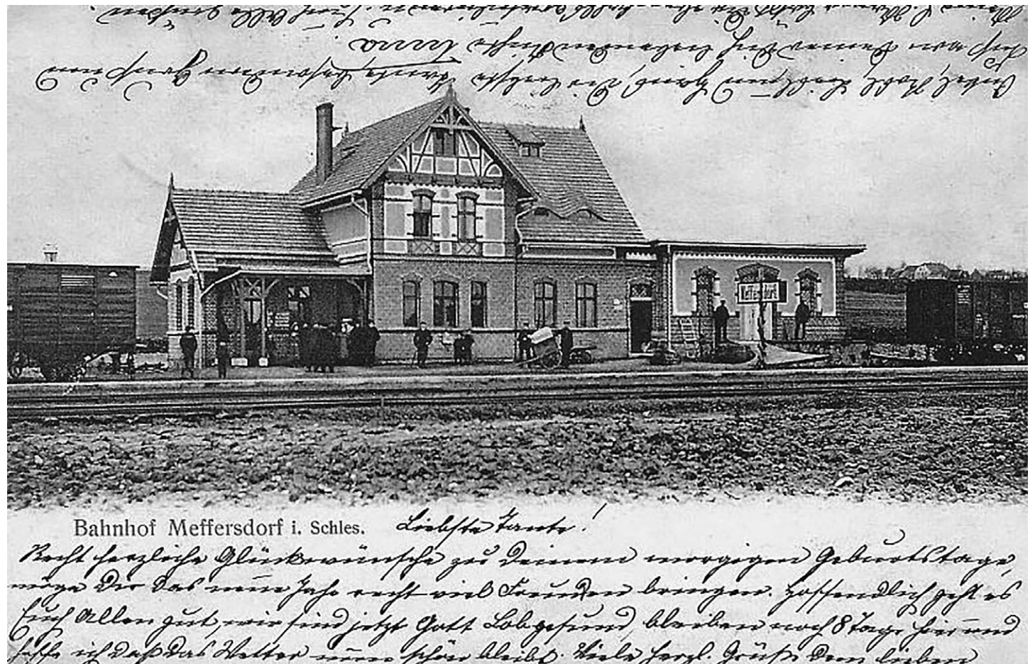
Dworzec kolejowy w Meffersdorf (Pobiedna) pocztówka z początku XX wieku

Zaprojektowanie odcinka o długości 6,1 km między Mirskiem a Pobodną nie sprawiło inżynierom większych trudności, podobnie jak sama jego budowa. Trasę wytyczono niemal dokładnie wzdłuż starego traktu handlowego, którym przez wieki podążali kupcy oraz pątnicy zmierzający do Sanktuarium Maryjnego w Hejnicach. W odległości 4,9 km od Mirska zlokalizowano przystanek w Wolimierzcu (ówcześnie Neu Scheibe, później Volkersdorf). Wybudowano tam jedynie niewielki drewniany budynek oraz ziemny peron z drewnianą krawężdzią.