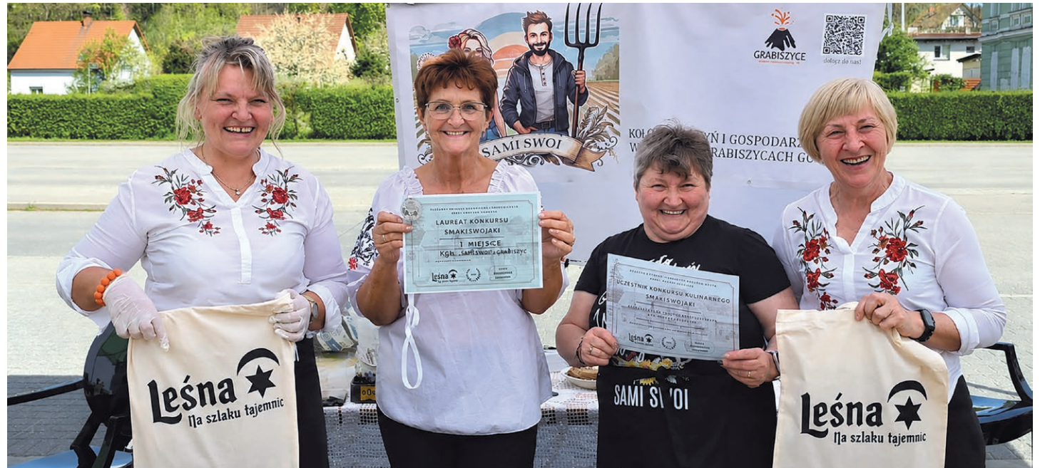
Majówka w Leśnej. Laureaci plebiscytu kulinarnego Smaki Swojaki KGiGW Sami Swoi z Grabiszyc Górnych

Organizatorem inicjatywy była grupa nieformalna Concordia, tworzona przez liczne stowarzyszenia, fundacje, koła gospodyń wiejskich i sołectwa, przy wsparciu Ośrodka Kultury i Sportu w Leśnej oraz Gminy Leśna. W wydarzenie zaangażowali się: Grupa Bez Obcasów, Browar Dom Piwny Stankowice, KGiGW Sami Swoi z Grabiszyc, Sołectwo Świecie, KGW Za-