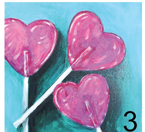
Marta Machowiak Lolipops, https://www.gallerystore.pl/marta-machowiak-3