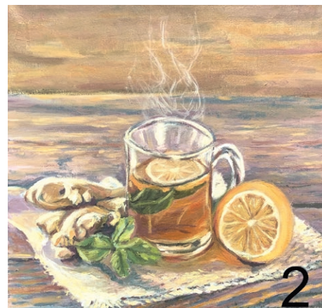
Grzegorz Wojcik Herbata, https://www.gallerystore.pl/marta-machowiak-3