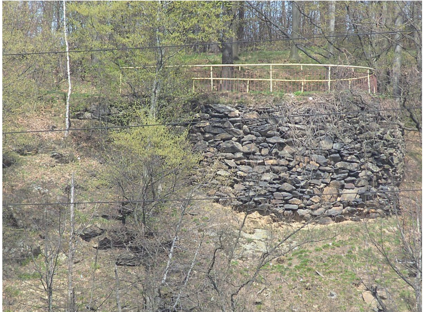
Platforma widokowa na Orlich Skalach w głębi okopy Pandurów

Przez wiele lat istniał kamień (obecnie kamień ten zaginął), z inskrypcją, który to przypominała o tej bitwie pod