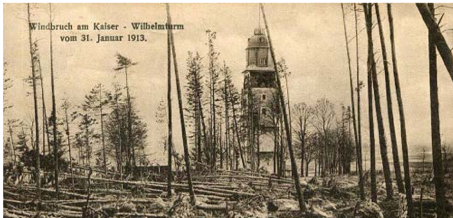
Wieża i skutki wichury z 31.01.1913 roku