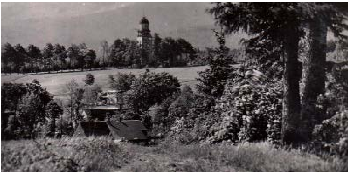
Gierałtówek, w tle wieża około 1935 rok