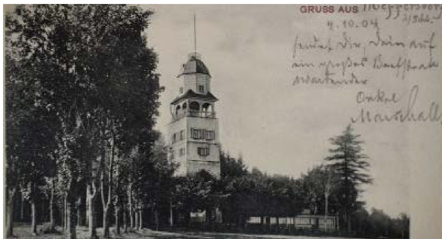
Wieża około 1904 roku

Norbert Włodarczyk Przewodnik Sudecki Przewodnik po Karkonoskim Parku Narodowym