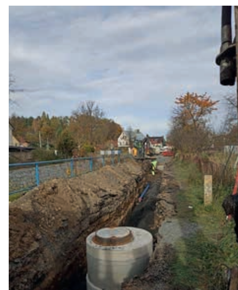
Budowa sieci wodociągowej w Miłoszowie