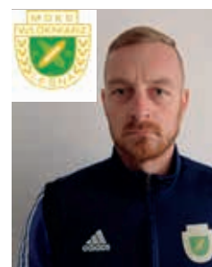
Trener UEFA A. Absolwent AWF Wrocław. Nauczyciel wychowania fizycznego. Trener grup dziecięcych (skrzat i orlik) w klubie Włókniarz Leśna. Trener edukacyjny w PZPN. Kontakt: wichowskir@tlen.pl