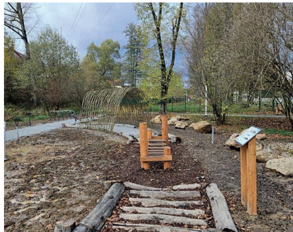
Ścieżka edukacyjna „Błękitno-Zielona Leśna”