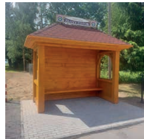
Wiaty przystankowa w Żłotym Potoku

Zadanie sfinansowane zostało w 100% ze środków budżetu Gminy Leśna.