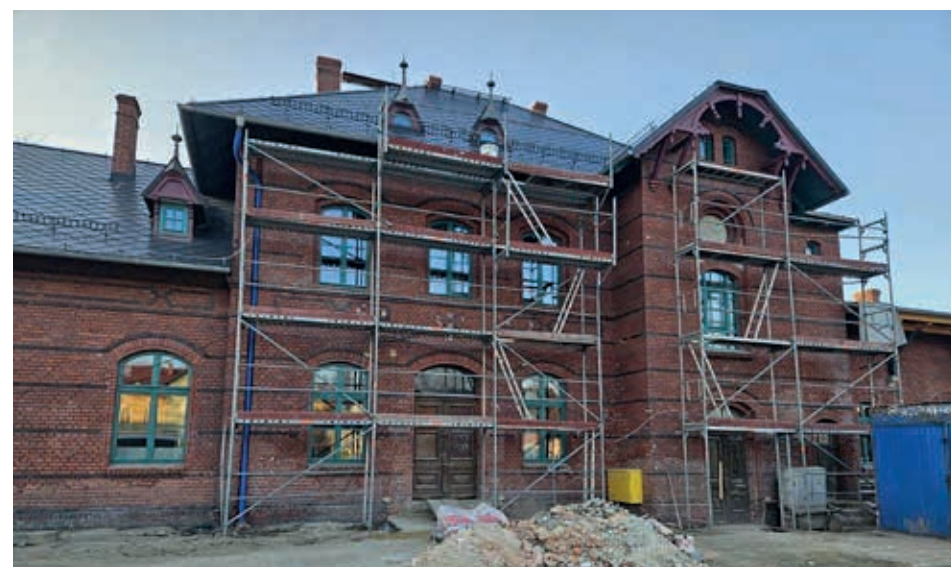
Modernizacja dworca PKP