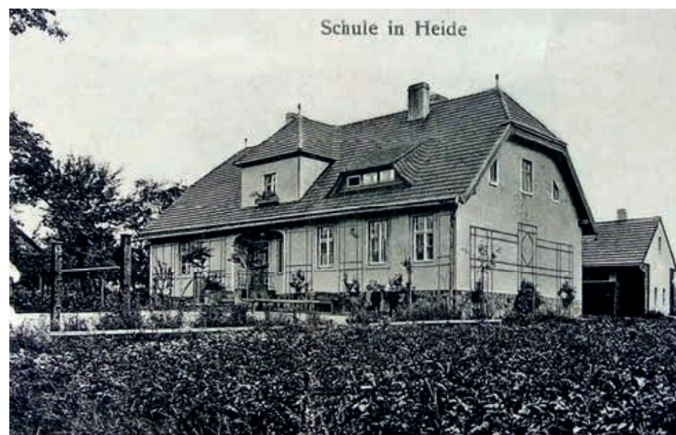
Borowiny – szkoła na początku XX wieku