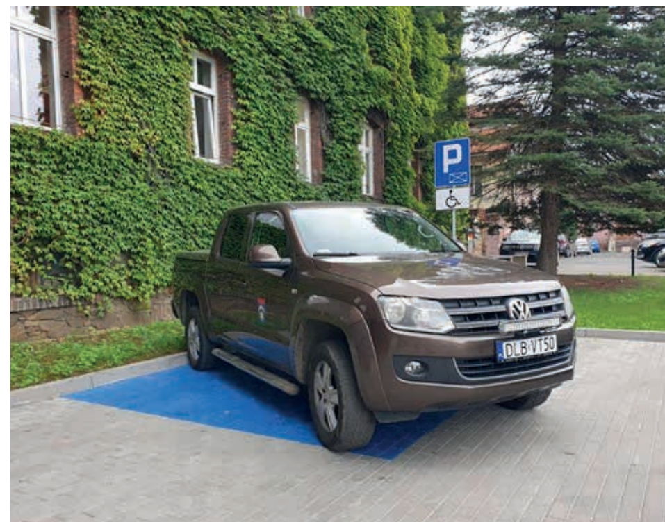
Zakup samochodu na potrzeby Referatu Inwestycyjnego