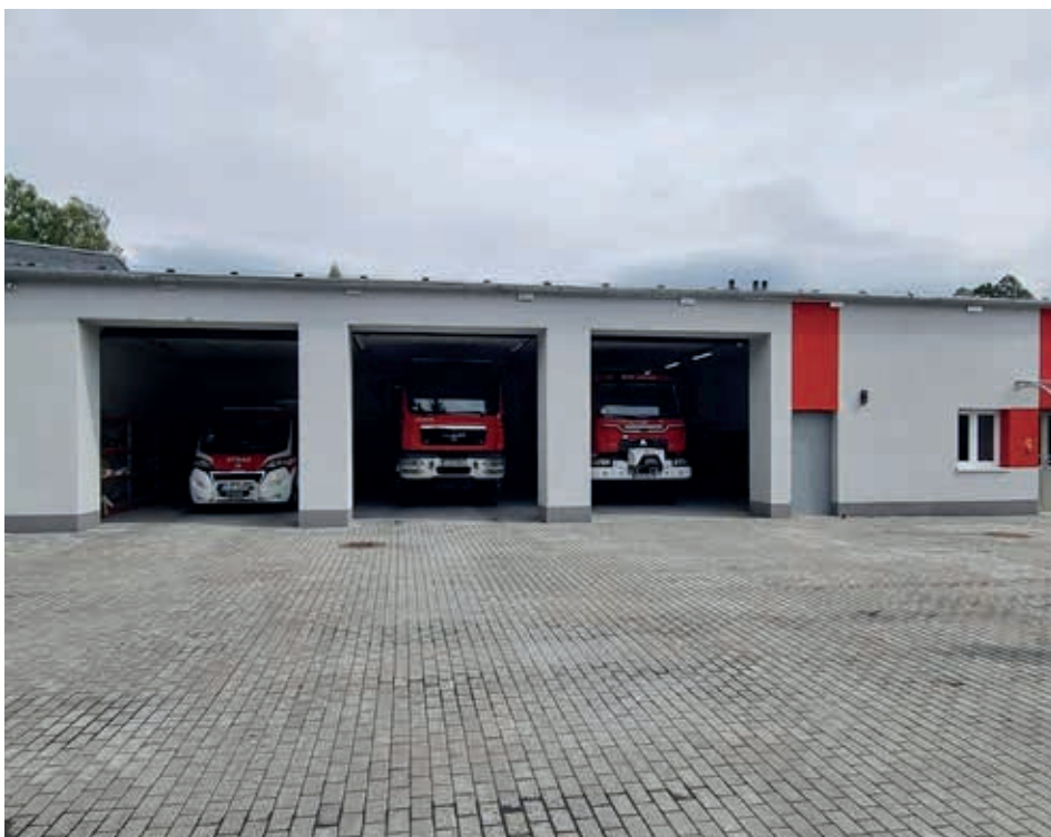
Centrum Zarządzania i Reagowania Kryzysowego