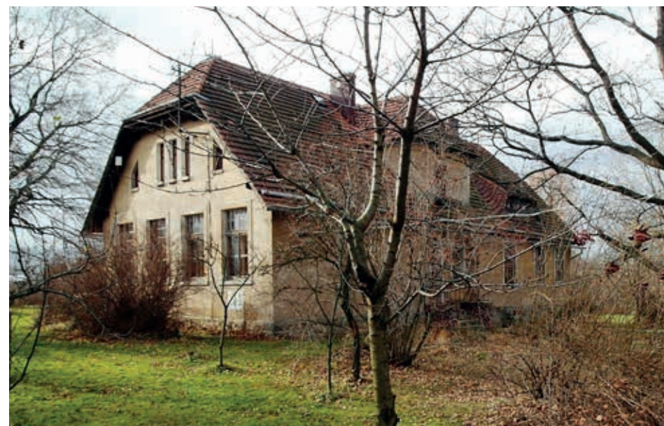
Borowiny – dawna szkoła około 2002 roku