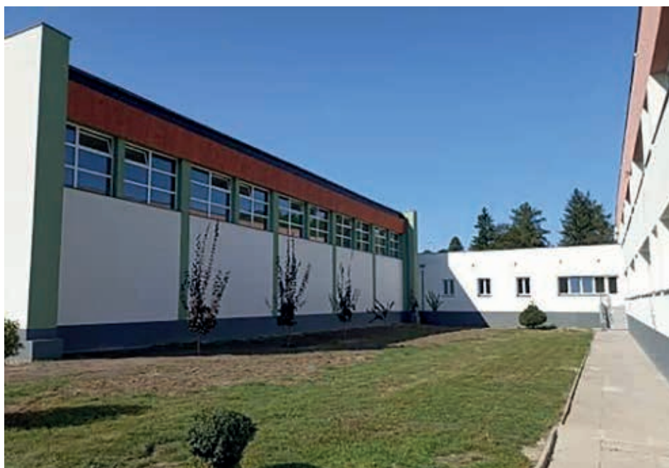
Termomodernizacja Szkoły Podstawowej w Smolniku