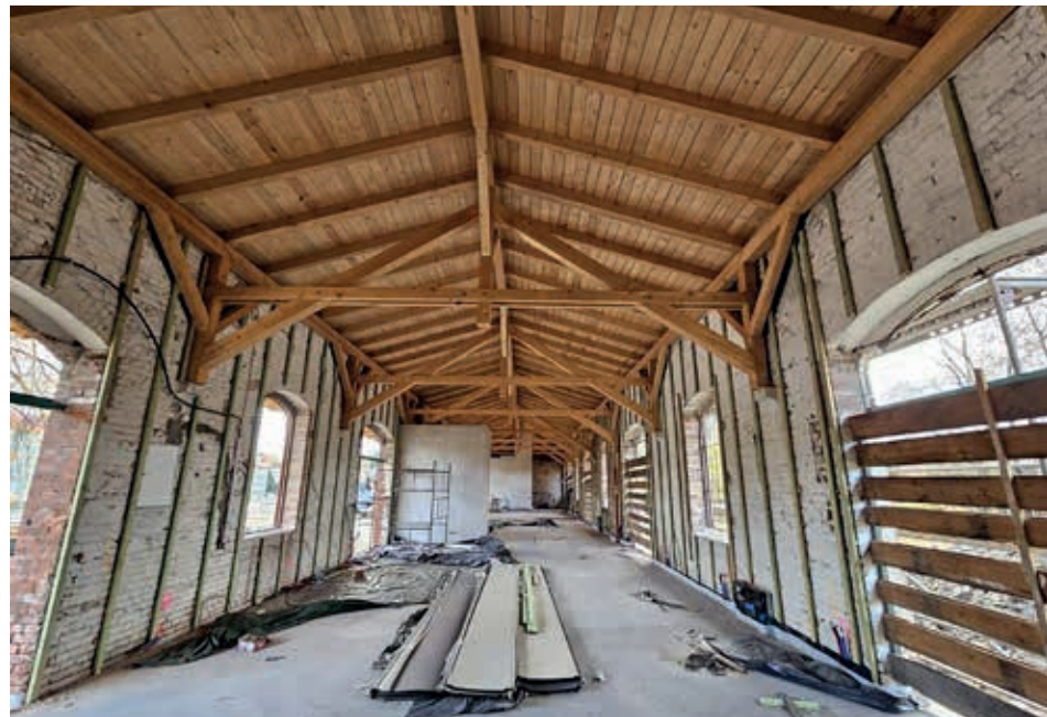
Modernizacja dworca PKP

W ramach zadania w 3 lokalizacjach w Leśnej tj. na terenie przy byłym gimnazjum, na skwerze przy ul. Kościuszki w Leśnej oraz na terenie wzdłuż Brunśnika za ogrodzeniem miejskiego stadionu sportowego oraz na terenie przy świetlicy wiejskiej w Świeciu przeprowadzono szereg robót ziemnych i budowlanych związanych z małą retencją m. in. utworzone zostały ogrody deszczowe w pojemnikach, ściany zielone,