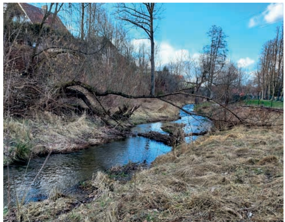
Ziołorośla wilgotnej łąki oraz powalone drzewo, które rośnie na brzegu Bruśnika, teraz pełni nową funkcję.

się zmian klimatycznych, są zjawiskiem coraz częściej występującym. Czy można się przed nimi całkowicie ochronić? Nie. Ale można w sposób skuteczny ograniczać szkody i straty powodziowe. Współczesne zarządzanie ryzykiem powodziowym nie polega na zapobieganiu wszelkim wylewom rzek, ale na tym, by rzeki wylewały w takich