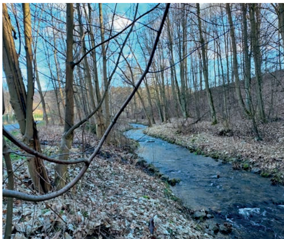
Cenne płaty lasów łęgowych nad Bruśnikiem, przechodzące w jaworzynę stokową i lasy klonowo-lipowe.

miejscach i w taki sposób, żeby negatywne oddziaływanie tych zdarzeń na ludzi było jak najmniejsze. Nadrzeczna roślinność jest bardzo ważna w tym kontekście.