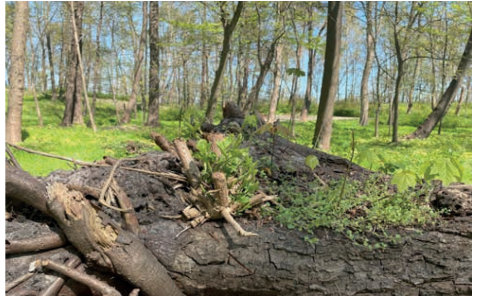
Różnorodność samosiejki młodych drzewek wyrastające na powalonym konarze.

Myśląc o rzece nie możemy zapominać o dolinie, która ją współtworzy. O roślinności, która ją porasta. Myśląc o ochronie przeciwpowodziowej czy zapobieganiu suszom musimy zacząć widzieć rzekę w całości, jako system wzajemnych relacji rzeki z jej otoczeniem. Rozumieć jak ten system działa i jaką rolę pełni każdy element. Tylko wtedy możemy skutecznie zarządzać zasobami wodnymi. Tworzyć sprzyjające warunki zarówno do zarządzania