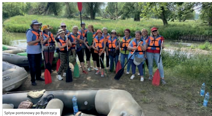
Spływ pontonowy po Bystrzycy