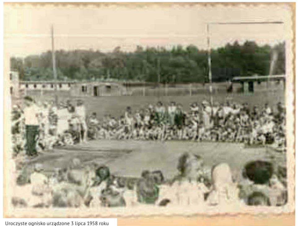
Uroczyste ognisko urządzone 3 lipca 1958 roku