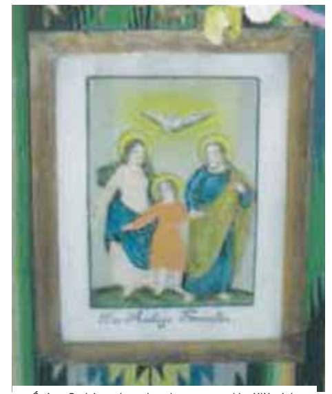
Święta Rodzina, obrazek malowany na szkle, XIX wiek