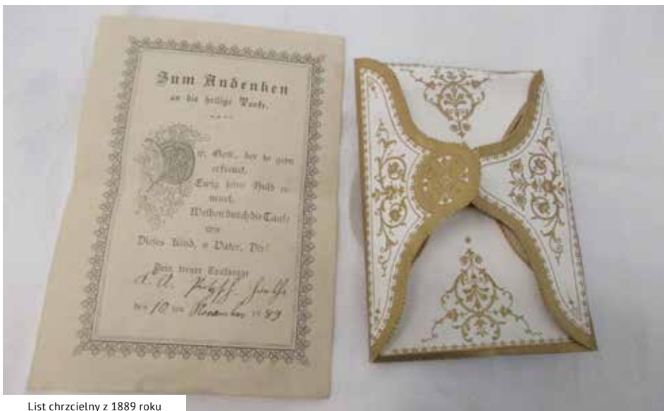
List chrzcielny z 1889 roku

Jak ja Anusię kołyszę, To ona lepie śpi. Jak ja kołysać przestanę, To zaraz się zbudzi. Jak ja Anusię kołyszę, To ona lepie śpi. Jak Ania duża urośnie, To będzie moją-ci.