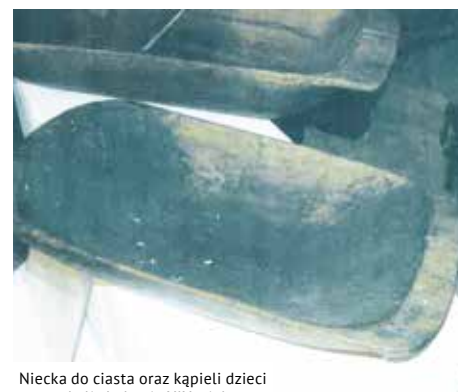
Niecka do ciasta oraz kąpeli dzieci z okolic Lubania XIX wieku