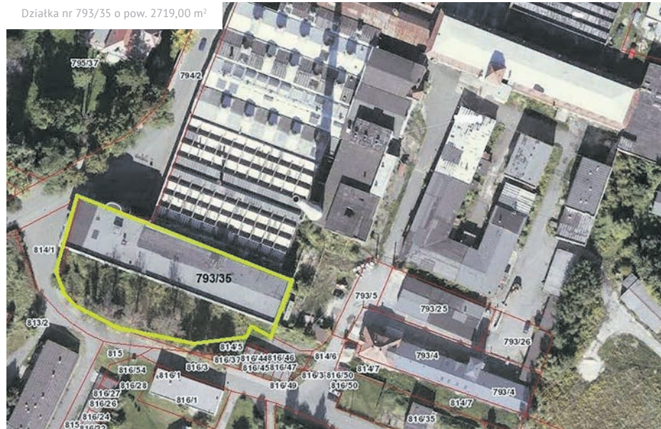
Działka nr 793/35 o pow. 2719,00 m 2

ferat Gospodarki Nieruchomościami i Ochrony Środowiska Urzędu Miejskiego w Leśnej przy ul. Elizy Orzeszkowej 11B, parter, pokój 11-12, tel. 757211239 wewnętrzny 40, 41 lub tel. komórkowy: 506 977 813, e-mail: gospnierz@lesna.pl