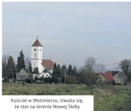
Kościół w Wolimierzu. Uważa się, że stoi na terenie Nowej Skiby

Ciekawostką dla potoku Złotniczka jest to, że kiedyś występowały w nim również raki, co podobno było ewenementem w świecie przyrody.