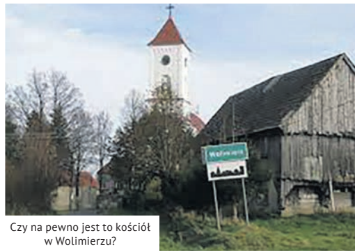
Czy na pewno jest to kościół w Wolimierzu?