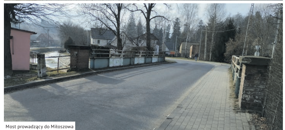
Most prowadzący do Miłoszowa