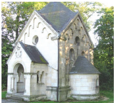
Kaplica na dawnym cmentarzu ewangelickim.

Do połowy XVIII wieku wieś administracyjnie przynależała do księstwa jaworskiego, następnie do 1815 roku przynależała do powiatu bolesławiecko-lwóweckiego, a od 1816 roku przynależała już do powiatu lubańskiego. Jest to jedna z trzech miejscowości na terenie Gminy Leśna, która leży na terenie Śląska, a nie Łużyc. Najwięcej mieszkańców liczyła w 1905 roku – 309, a najmniej w 2011 roku – 210, z kolei w 1816 roku liczba mieszkańców wynosiła 259. Kościelniki Górne leżą na wysokości od 230 do 235 metrów n.p.m. i są przykładem tzw. wsi łańcuchowej, położonej wzdłuż prawego brzegu Kwisy. Od Kościelników Średnich odcięte są potokiem Glińcem, do którego jeszcze wpada potoczek nazywany przed wojną Lehmgrund (nie znalazłem polskiej nazwy tego potoku). W rejonie wsi występują bogate pokłady kasyterytu o koncentracji nawet do 68 g/m 3 . Minerale ten ma zastosowanie w jubilerstwie oraz jest głównym źródłem cyny w przemyśle.