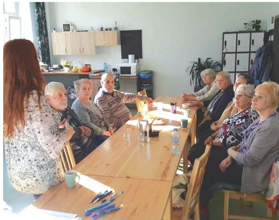
Fundacja Symbioza podczas szkolenia dla seniorów w Centrum Społecznym w Leśnej