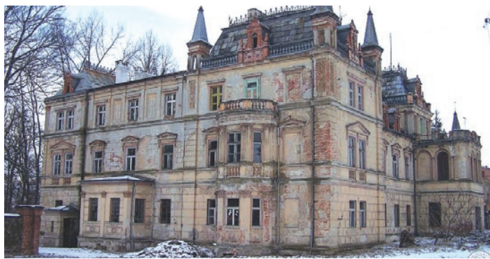
Pałac 2006 rok