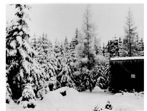
Domek myśliwski zimą porą.