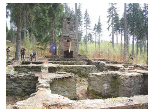
Prace porządkowe w miejscu, gdzie stał domek, wykonuje co 1-2 lata Stowarzyszenie „Zamek Czocho”