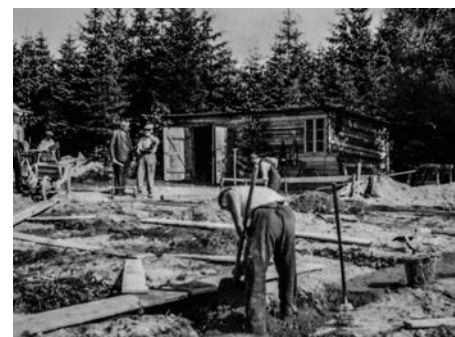
Wylewanie ław fundamentowych pod domek.