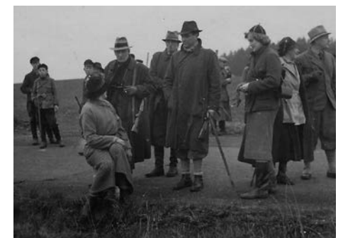
Rodzinne polowania zawsze kończyły się przy domku myśliwskim.