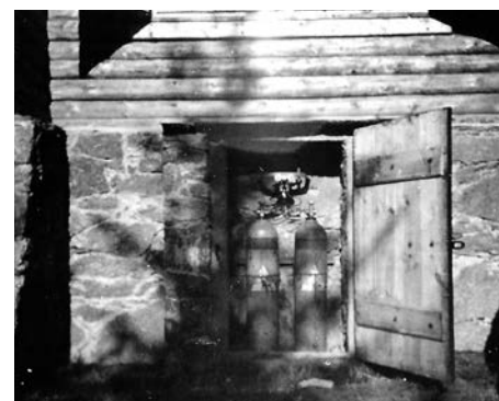
Miejsce na butle gazowe, służące do ogrzewania wnętrza.