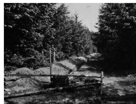
Budowa wodociągu (ujęcie wody znajdowało się поблизу dzisiejszego wzgórza Wojkowa, wykorzystano przepływ grawitacyjny)