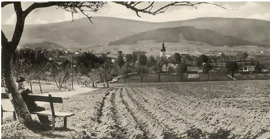
Droga z Unięcic do Woli Sokołowskiej

Norbert Włodarczyk Przewodnik Sudecki Przewodnik po Karkonoskim Parku Narodowym