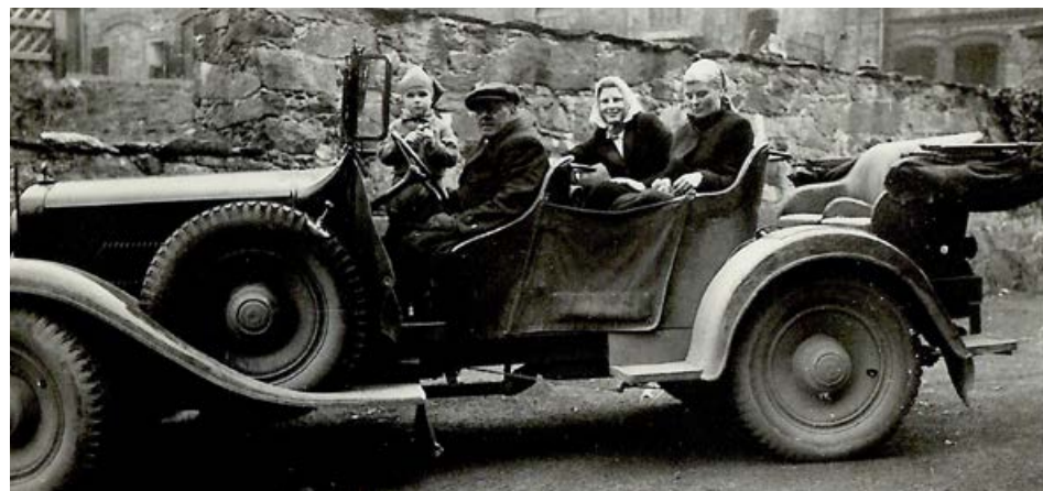
Horch 830R (tzw. Kübelwagen) przy murze przed bramą wjazdową do zamku Czocho oraz na pikniku przed domkiem myśliwskim (w Lesie Stankowickim)

Autor bada i popularyzuje historię regionu, w tym zamku Czocho (o którym napisał m.in. w swoich książkach „Tajemnice zamku Czocho”, „Perły znad Kwisy” i w albumowym wydaniu „Czocho. Zamki i pałace Polski”). Kontakt: loginfo@go2.pl