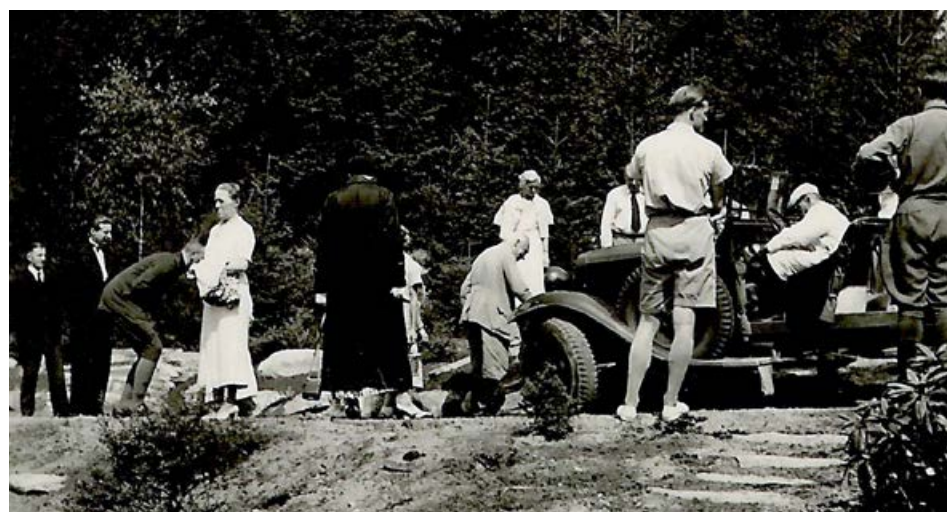
Horch 830R (tzw. Kübelwagen) przy murze przed bramą wjazdową do zamku Czocho oraz na pikniku przed domkiem myśliwskim (w Lesie Stankowickim)