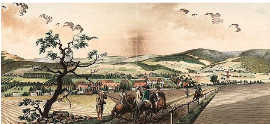
Panoramy okolicy z XVIII wieku_miedzioryt

Ongiś wracał pewien chłop późno z gospody „Pod ostatnim groszem”. Kiedy doszedł do Góry Halerzowej, widzi, jak w niewielkiej odległości unosi się lichtarz. Chłop zaczął szydzić z niego beztrudno, a że był po paru głębszych to odwagi mu nie brakło. Nagle duch przeskoczył do zuchwalca i towarzyszył mu, aż do drzwi jego domu. Chłop wszedł do swojej chaty i rzucił jeszcze podczas zamykania drzwi złemu towarzyszowi całą masę obelżywych słów. Wkrótce ryknął z bólu, bo wszystkie jego włosy na głowie zapaliły się i spłonęły doszczętnie jasnym płomieniem. Szyderycy do końca życia już włosy nie odrosły”. ✘