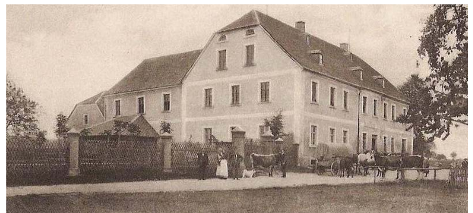
Browar w Woli Sokołowskiej