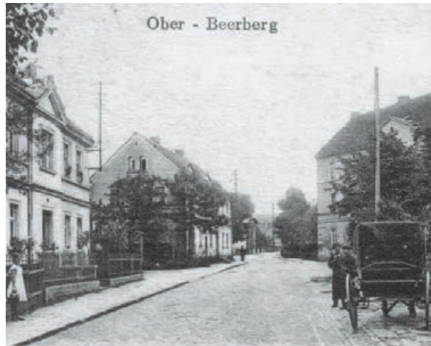
Baworowo około 1925 roku