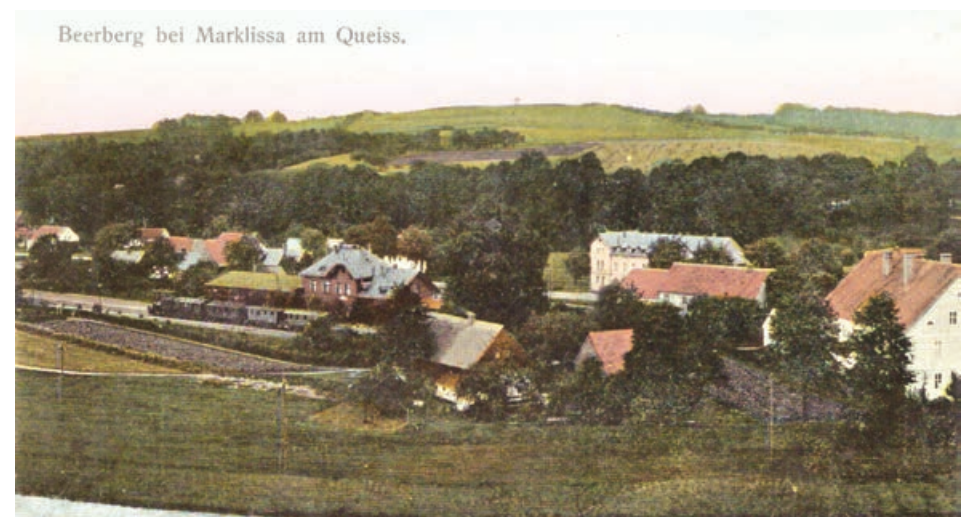
Panorama wsi około 1910 roku

Z Baworowa prowadzą liczne ciekawe szlaki turystyczne w kierunku m.in. zamku Czocho i zamku Rajsko. Punktem startowym do wypraw turystycznych są okolice Łużyckiego Banku Spółdzielczego, który jest ulokowany w budynku z przełomu XIX oraz XX wieku. Wcześniej w miejscu gdzie obecnie stoi Bank wzmiankuje się, że do 1815 roku istniała komora celna. ✘