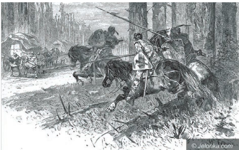
Atak Raubritterów na Kupców

Najazd zakończył się sukcesem, przy czym ilość zagarniętych łupów była podobno olbrzymia. Jednakże zrabowane łupy ograniczały tempo marszu, a do tego przy okazji rabowano też posiadłości rycerskie na trasie powrotnej,