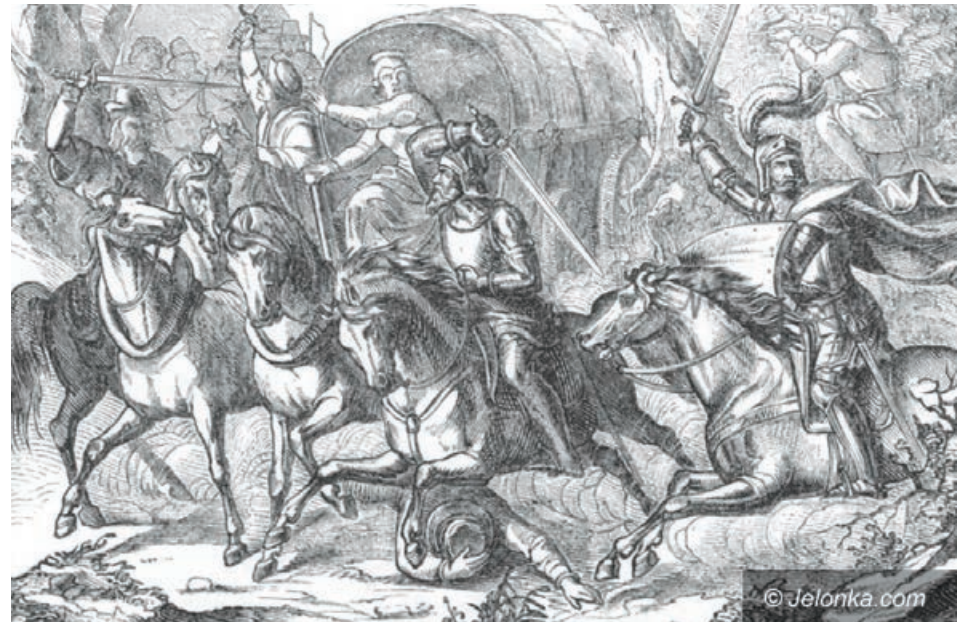
Napad Rycerzy Rabusiów na Kupców