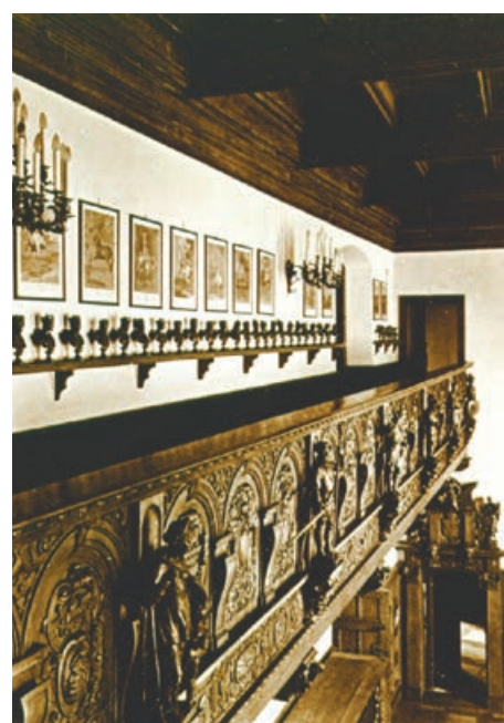
Zamek Czocha, galeria nad Salą Rycerską, gdzie stały popiersia wszystkich carów rosyjskich. Obok – stan dzisiejszy.