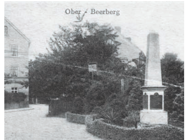
Baworowo około 1925 roku

wojen na tym terenie. Podczas wojen husyckich jest aż dwukrotnie rabowana oraz palona odpowiednio w 1427 roku oraz w 1431 roku. Kolejne spustoszenie Baworowo doświadcza podczas wojny 30-letniej, kiedy była wielokrotnie rabowana podczas przemarszów wojsk. Kolejny raz granica na Kwisie pojawia się w 1635 roku, kiedy to lewy brzeg Kwisy wraz z Leśną znajduje się w obrębie Saksonii. Na początku XVIII wieku wieś dzieli się na dwie części.