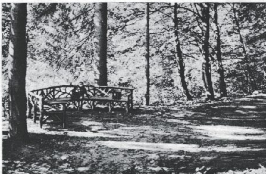
Gruss vom Bismarckplatz b. d. Talsperre bei Marklissa.