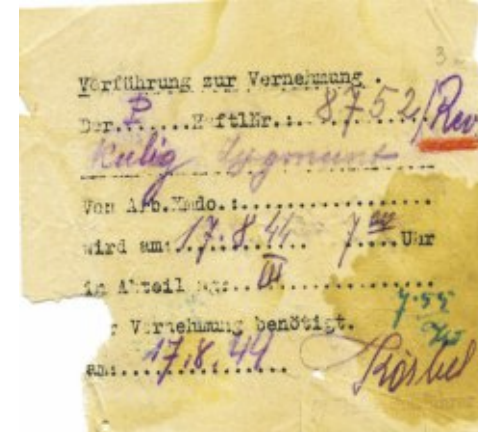
Zaświadczenie nadające Z. Kuligowi nr obozowy 8752 w Gross-Rosen