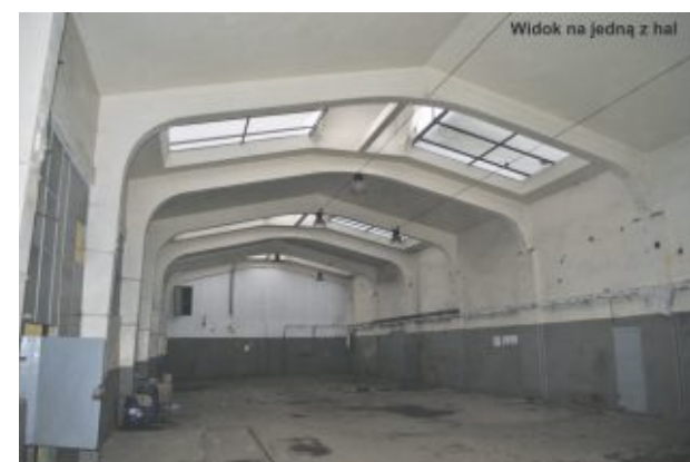
Widok na jedną z hal