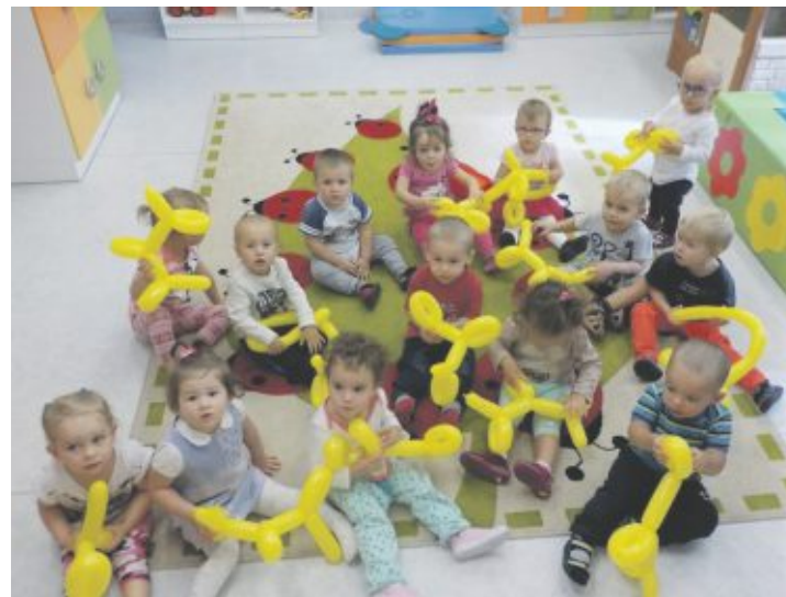
Poznajemy zwierzęta żyjące na farmie i łące