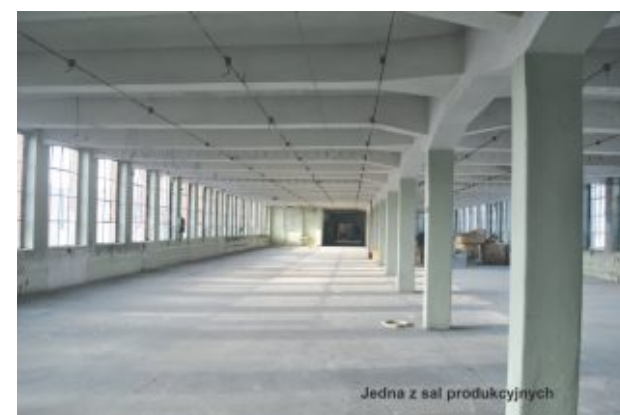
Jedna z sal produkcyjnych