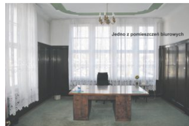
Jedno z pomieszczeń biurowych