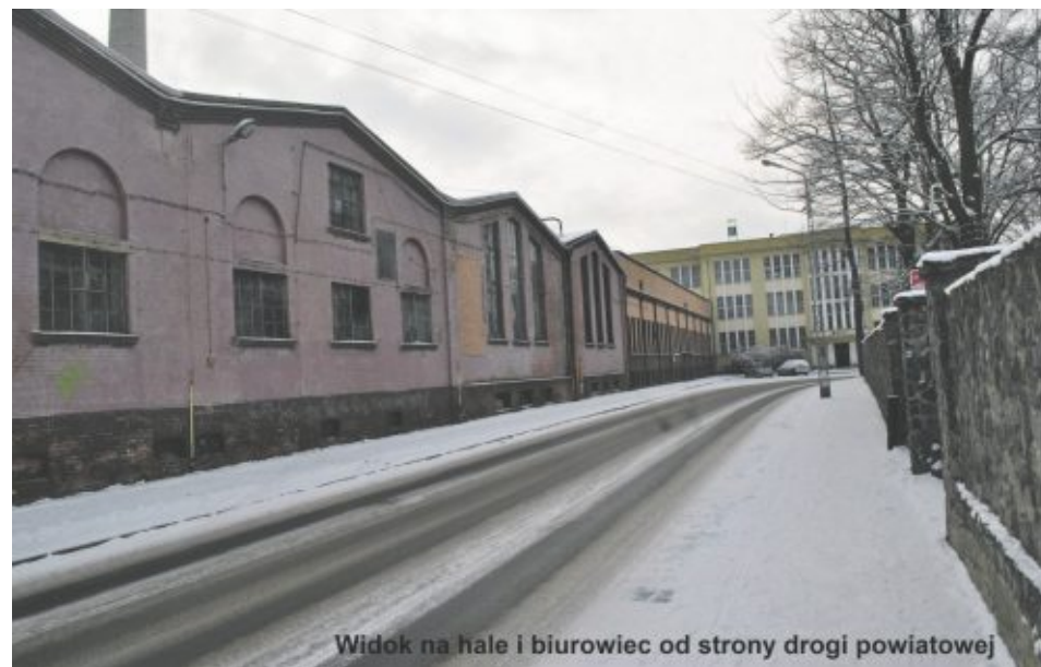
Widok na hale i biurowiec od strony drogi powiatowej

W sąsiedztwie funkcjonują przedsiębiorstwa produkcyjne.