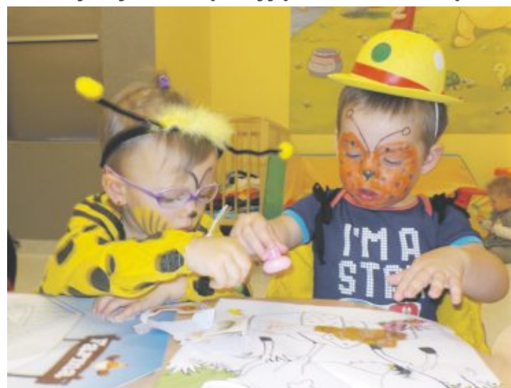
Nowe wyposażenie żłobka