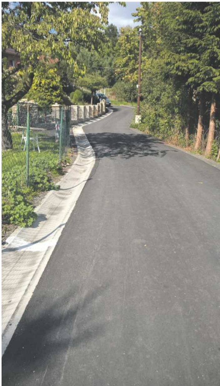
◀ Droga w Miłoszowie

- Dostrzegamy i wspieramy wszelkie inicjatywy społeczności lokalnych. Np. w bieżącym roku zmodernizowaliśmy drogę prowadzącą do budynków mieszkalnych oraz do terenu, na którym cyklicznie odbywa się impreza związana