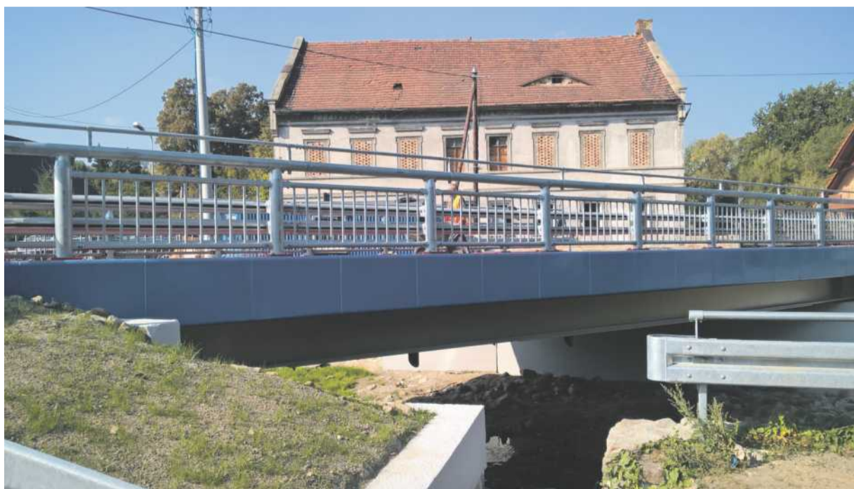
▼ Most w Miłoszowie