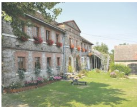
I miejsce - gospodarstwo Izabela Krasna