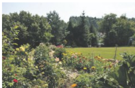
I miejsce - zagroda - Edyta Durowicz