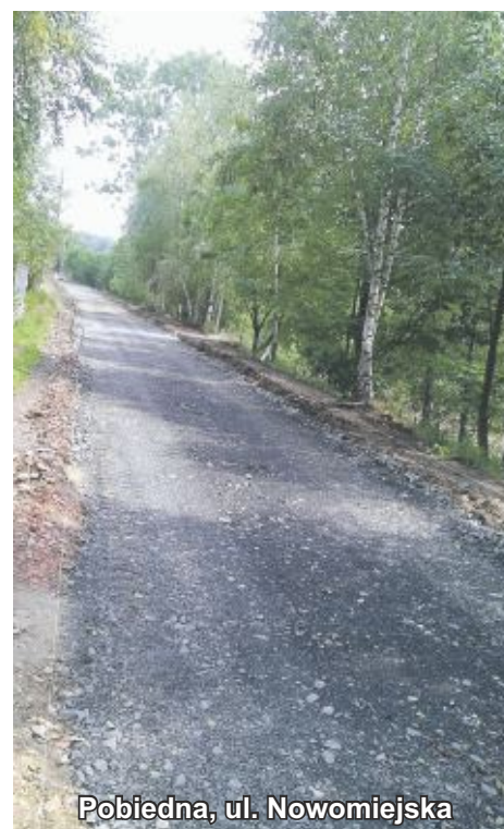
Pobiedna, ul. Nowomiejska