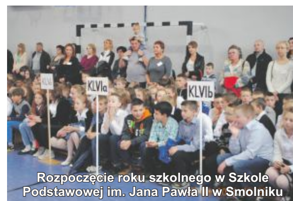
Rozpoczęcie roku szkolnego w Szkole Podstawowej im. Jana Pawła II w Smolniku