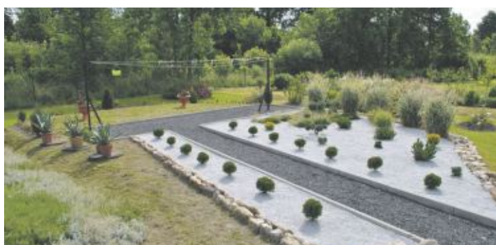
I miejsce „Najładniejszy ogród przydomowy” – Lucyna Gryniewicz