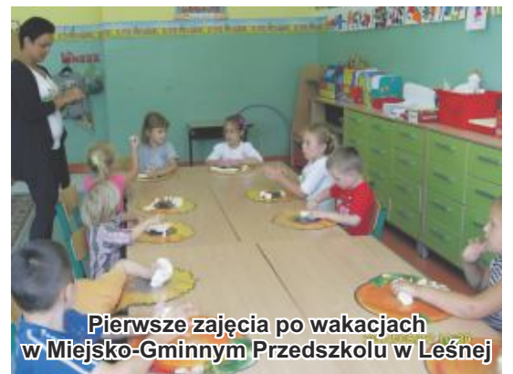
Pierwsze zajęcia po wakacjach w Miejsko-Gminnym Przedszkolu w Leśnej

zerowego. Naukę w klasie pierwszej rozpoczęło 9 uczniów, w tym 8 sześciolatków.