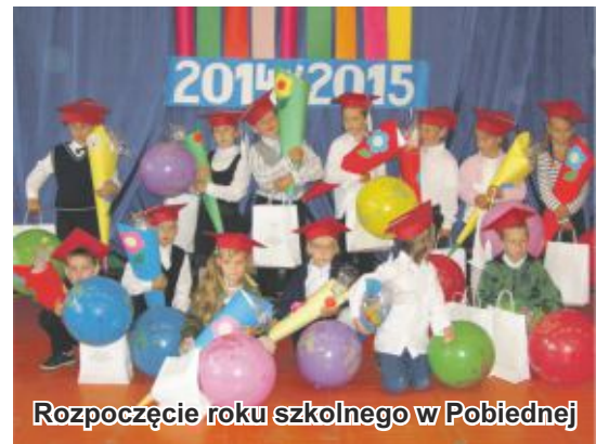
Rozpoczęcie roku szkolnego w Pobiednej

Do Szkoły Podstawowej im. Jana Brzechwy w Grabiszycach uczęszcza 50 uczniów oraz 13 dzieci do oddziału