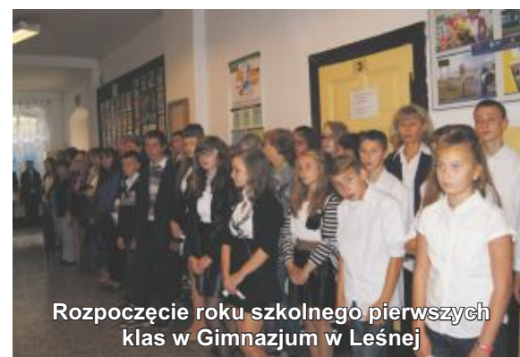
Rozpoczęcie roku szkolnego pierwszych klas w Gimnazjum w Leśnej

Szkoły i Przedszkola Gminy Leśna zostały należycie przygotowane do rozpoczęcia nowego roku szkolnego. Każda z pięciu placówek oświatowych prowadzonych przez Gminę Leśna posiada kadre pedagogiczne posiadające odpowiednie kwalifikacje. W okresie wakacyjnym wykonano szereg prac remontowych, poprawiających bezpieczeństwo i estetykę budynków i otoczenia.