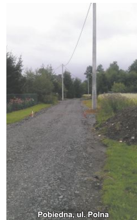
Pobiedna, ul. Polna