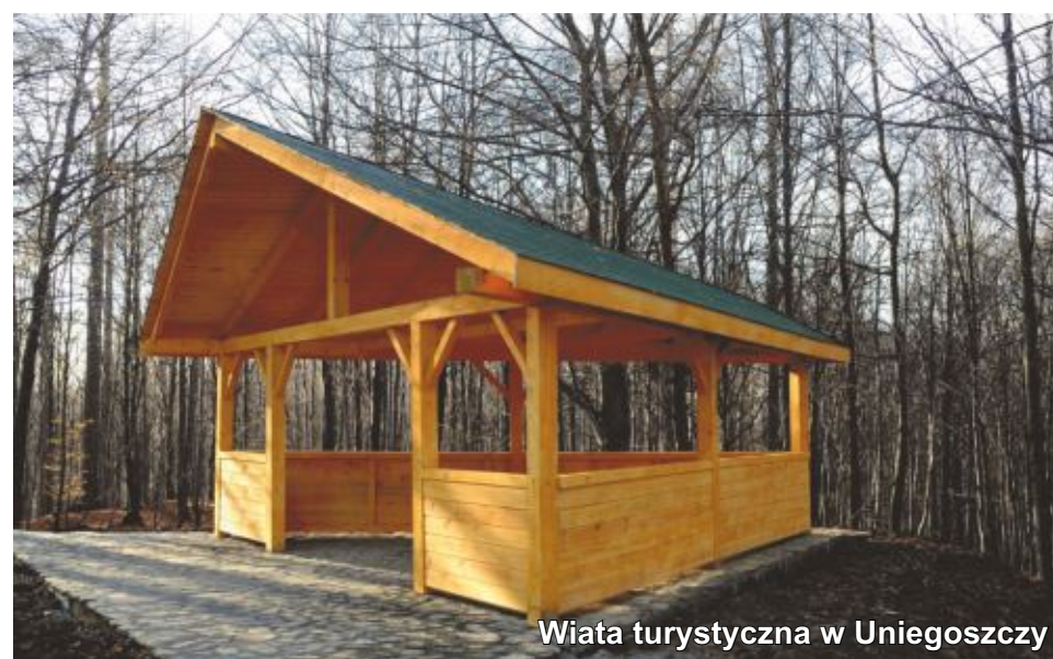
Wiatka turystyczna w Uniegoszczy

To jedno z ulubionych miejsc dzieci z Lubania gdzie razem ze swoimi opiekunami mogą biwakować poznając las i jego tajemnice. Tutaj również, po uzgodnieniu z leśniczym z Leśnictwa Przylesie (Tel. 757211296 lub 603857188, leśniczówka w Przylasku tuż przy drodze do