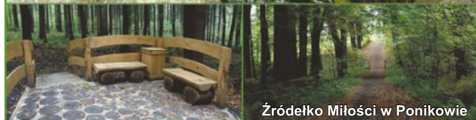
Źródło Miłości w Ponikowie

Wasze propozycje. Napiszcie nam swoją wersję i stwórzmy razem legendę dla tego miejsca. Swoje propozycje wysyłajcie na adres: