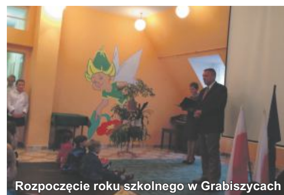
Rozpoczęcie roku szkolnego w Grabiszycach