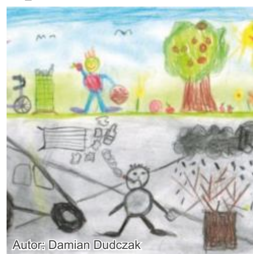
Autor: Damian Dudczak

aplikacji konkursowej na Facebooku do 15 czerwca 2014r.: https://www.facebook.com/listydlaziemi/app_150856638420755