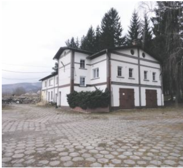
2. Nieruchomość w Pobiednej przy ul. Nowomiejskiej