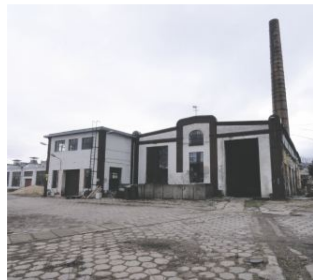
3. Nieruchomość w Pobiednej przy ul. Nowomiejskiej

Wszystkie ogłoszenia dostępne są na stronie internetowej www.lesna.pl w zakładce Nieruchomości oraz Biuletynie Informacji Publicznej Urzędu Miejskiego w Leśnej w zakładce Przetargi. Dodatkowych informacji udziela Referat Gospodarki Nieruchomościami, Rolnictwa i Ochrony Środowiska Urzędu Miejskiego w Leśnej przy ul. Świerczewskiego 11b, I piętro. (S.F.)