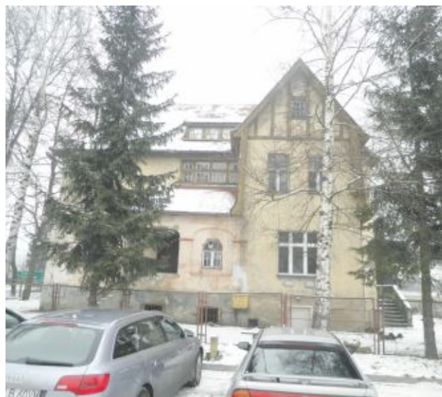
1. Nieruchomość w Leśnej przy ul. Sienkiewicza 60

zabudowanej kompleksem hal produkcyjnych. Nieruchomość wyposażona jest w sieć elektryczną, wodno-kanalizacyjną. Możliwości wykorzystania nieruchomości: działalność produkcyjna, bazy, składy, magazyn. Rokowania odbędą się w dniu 14 marca 2014 r. Cena wywoławcza nieruchomości 285 000 zł. Zgłoszenia do udziału w rokowaniach należy składać najpóźniej do dnia 10 marca. Wadium w wysokości 28 500 zł płatne jest do 10 marca.