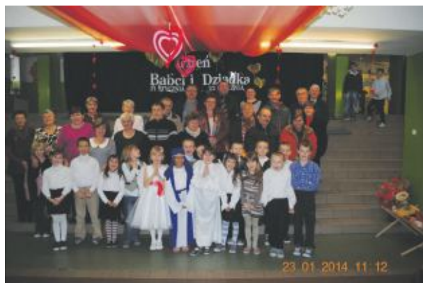
Szkoła Podstawowa w Smolniku

Obchody Dnia Babci i Dziadka na stałe weszły w kalendarz imprez w naszych szkołach i przedszkolach. Te szczególne dni są okazją to tego, aby okazać wdzięczność za wszystkie ciepłe słowa, gesty i miłość.