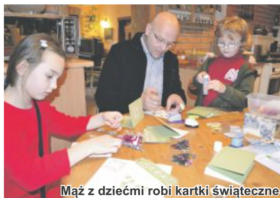
Mąż z dziećmi robi kartki świąteczne

wcześniej. Padał śnieg na zamku nie było jeszcze gości. Zjechaliśmy do Leśnej, aby kupić parę drobiazgów i gazetę z ogłoszeniami. W sklepiku w Rynku sprzedawca zapytał, o jakie ogłoszenia chodzi. Kiedy powiedzieliśmy, że szukamy tutaj domu dał nam telefon do mamy swojej sąsiadki, która chce sprzedać gospodarstwo. W sama Wigilię, ok. 14 00 śnieg padał coraz mocniej, zadzwoniliśmy pod podany telefon. Właścicielka zgodziła się od razu pokazać nam dom. Podjechaliśmy pod wskazany adres. Miła Pani podjechała z nami do Miłoszowa. Auto zostawiliśmy pod krzyżem, bo śniegu było już po kolana. W domu zastaliśmy mamę właścicielki. Nie myśleliśmy o zakupie gospodarstwa, ale, gdy zobaczyłam nieczynną już stajnię wiedziałam, że to miejsce będzie moje. Pomieszczenie ze słupem po środku, sklepieniami krzyżowymi zrobiło na mnie wrażenie. Cena była jednak do przemyślenia. W styczniu odezwała się do nas właścicielka domu zgadzając się na