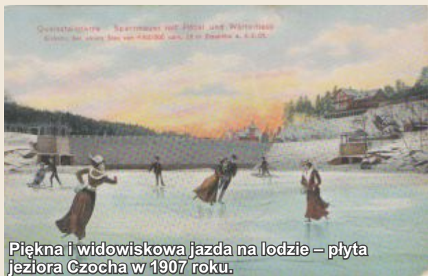
Piękna i widowiskowa jazda na łodzi – płyta jeziora Czochoa w 1907 roku.

Stara historyczna nazwa Kwisy podawana jest jako GWIZDA. Językoznawcy skłonni są uznać pochodzenie nazwy Kwisy od łuzycyjskiego słowa GWIZD lub HWIZD, co