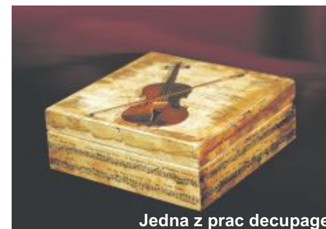
Jedna z prac decoupage

Drugie „hobby”, to poznawanie ludzi. W naszej działalności codziennie poznajemy nowych ludzi, od których my możemy się