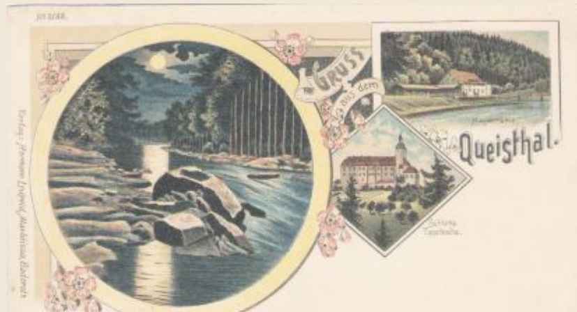
Romantyczne widoki rzeki Kwisy w nocy. Z pięknym księżycem kąpiącym się w nurtach rzeki. Obok szlifiernia pereł oraz Zamek Czochoa przed pożarem 1889 roku.

Szlifiernie pereł istniały nie tylko koło