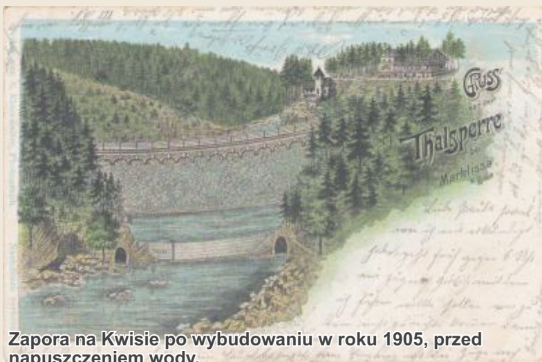
Zapora na Kwisie po wybudowaniu w roku 1905, przed napuszczeniem wody.