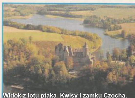
Widok z lotu ptaka Kwisy i zamku Czochoa.

Tragiczne skutki coraz liczniejszych powodzi skłoniły władze pruskie (na Kongresie Wiedeńskim w 1815 roku zabrano Górne Łużycy Saksonii i przekazano Prusom), do podjęcia decyzji o budowie zapór przeciwpowodziowych na Kwisie. Nie spowodowało to całkowitego ujarznienia Kwisy, ale ograniczyło jej niszczycielskie wylewy. W okresie międzywojennym największa powódź miała miejsce w 1926 roku, a po wojnie wielkie wylewy Kwisy odnotowano w 1958, 1977 i 1981 roku.